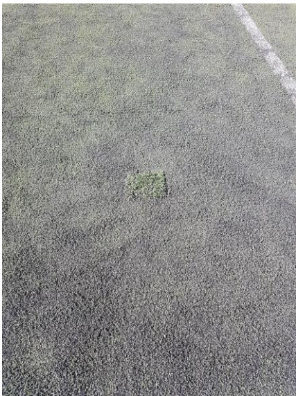
A műfüves sportpálya jelenlegi állapota (a barázdák látható megjelenése a kopás egyértelmű jele)

A mindennapos testnevelés ellátása a téli szezonban egyetlen rendelkezésre álló kisméretű tornaterem segítségével lehetetlen feladat. Ráadásul, több hónapos bevételkiesést okoz minden évben ez az időszak. Műszakilag nem lenne akadálya a műfüves focipálya fölé sátrötetöt emelni. Ezzel a téli szezonban megháromszorozódhatna (a pálya tanórai kettéválasztásával) a testnevelésre alkalmas sportlétesítményeink száma. A téli idény bérleti kihasználtsága és a jövedelem meghaladná a többi szezonét, így az intézmény saját bevételi forrását jelentősen tudnánk növelni. Ezt a célt is elsődlegesen pályázati forrásból tudnánk megvalósítani.