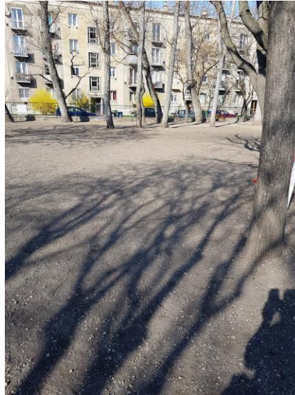
Az iskolaudvar jelenlegi állapota

pályázaton , és az az elképzelésem, hogy hosszú távon a teljes udvar felújítása megtörténjen, ide értve nemcsak a játszóvár alatti gumiszőnyeg pótlását, hanem a felvonulási tér, és a teljes udvar parkosítását is, ezt látom egy olyan célnak, melyet rövid távon is képesek leszünk megvalósítani, és a gyerekeink számára, egy otthonos és barátságos környezetet is meg tudunk teremteni.