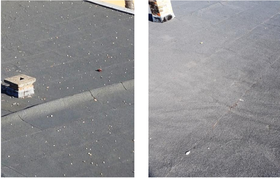
A tető jelenlegi állapota

(A kátránypapíros tetőburkolás, a lejtés az épületen belüli vízvezetés érdekében)